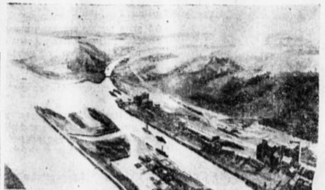
Вход в Волго-Донской канал у Саренты.