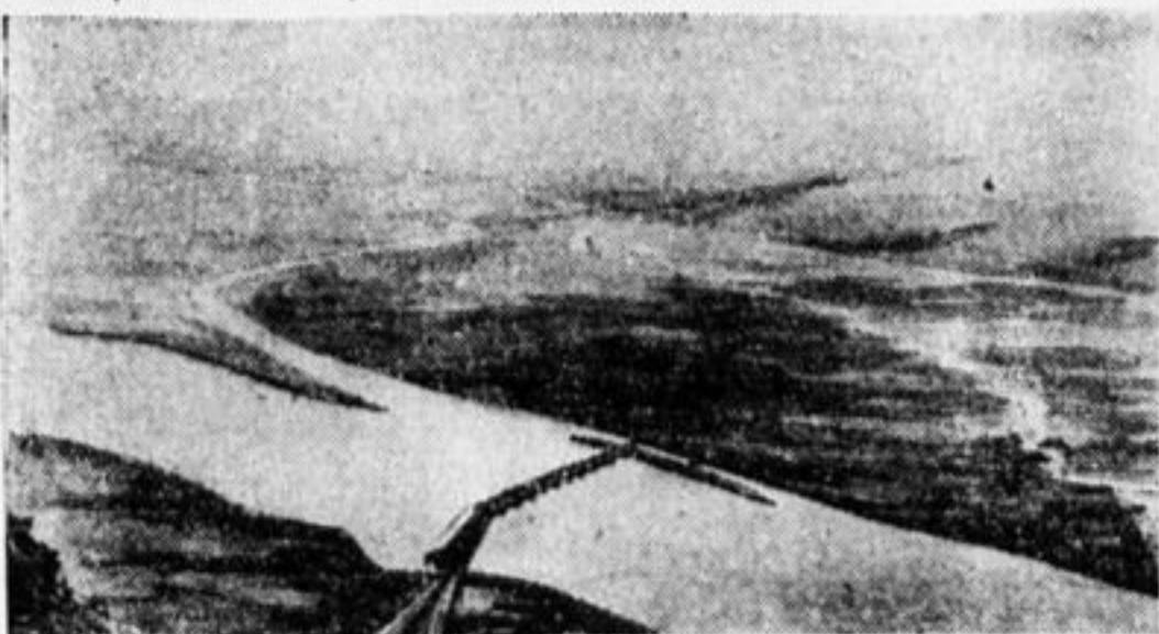
Выход из канала в реку Дон у хутора Кумовского.